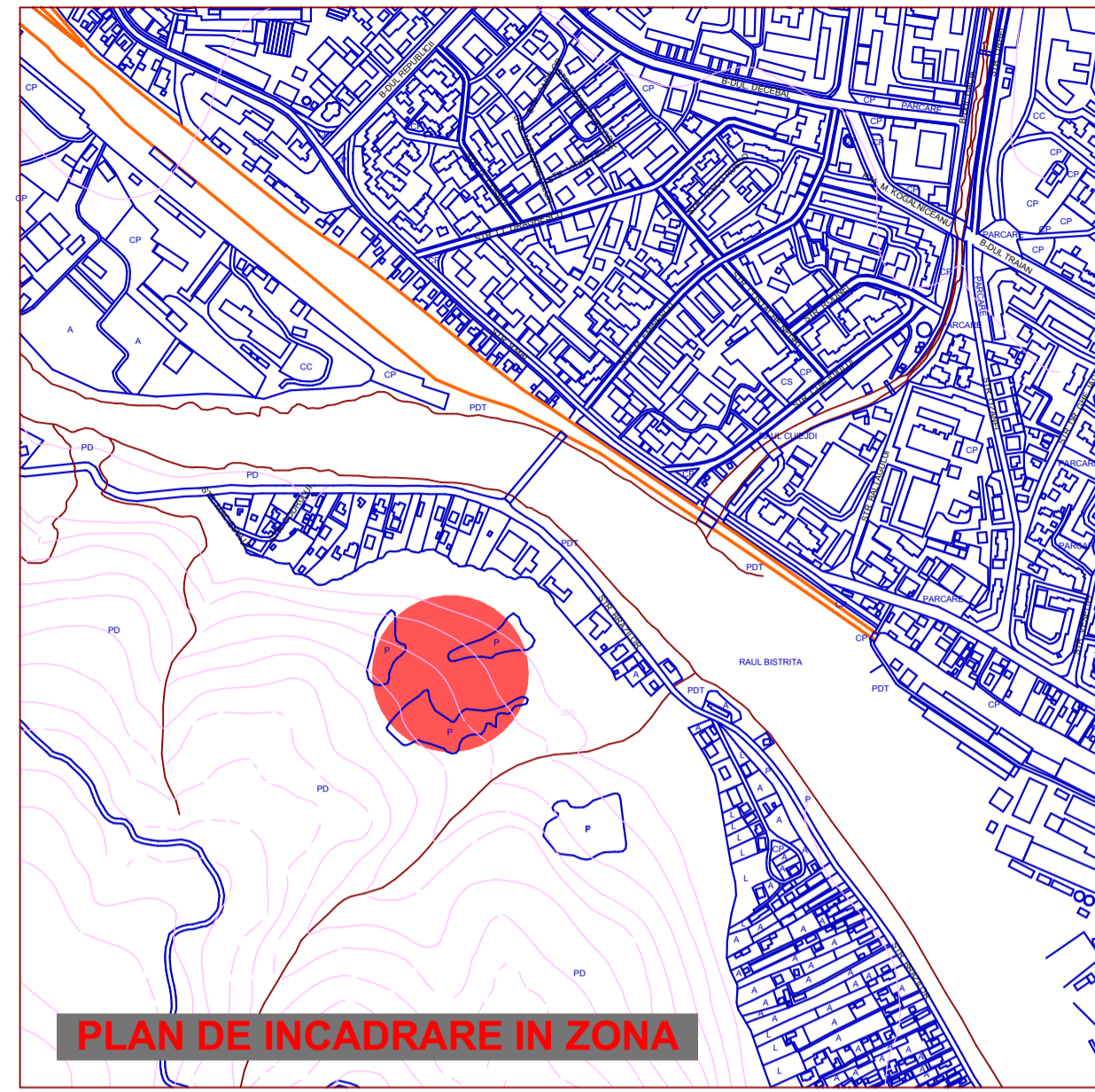
PLAN DE INCADRARE IN ZONA