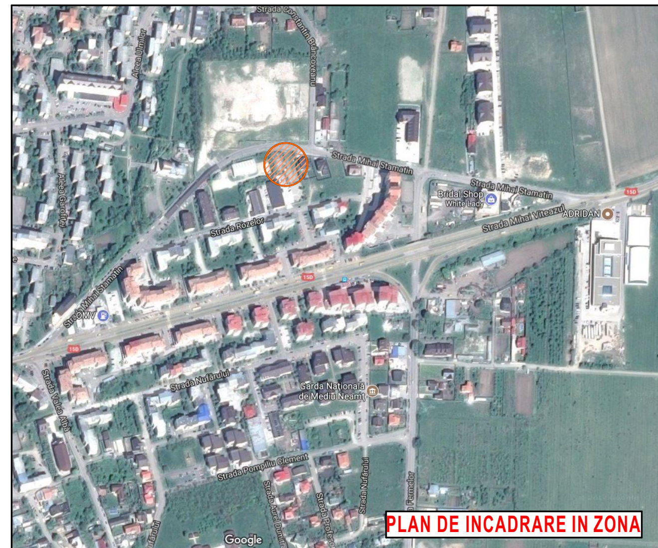
PLAN DE INCADRARE IN ZONA