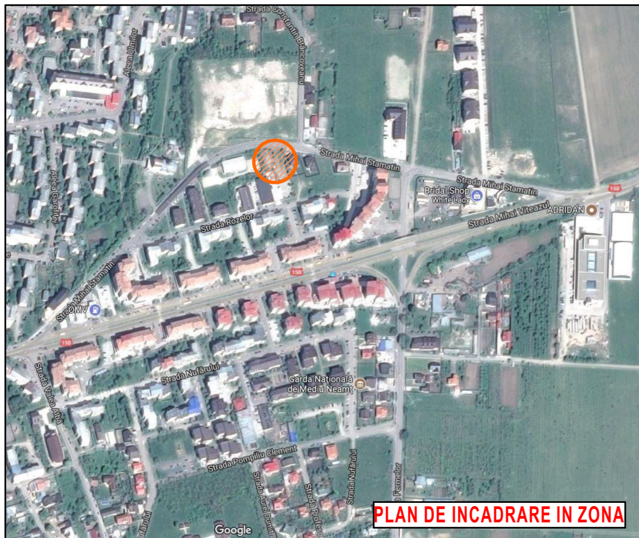
PLAN DE INCADRARE IN ZONA