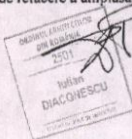
arh. Diaconescu Iulian

Obiectivul proiectat nu necesita lucrari speciale de refacere a amplasamentului dupa finalizarea lucrarilor de executie.